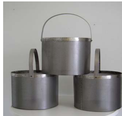
Beizkörbe aus Edelstahl

Standardausführung rund Bügel starr oder beweglich Lochungen 2 mm – 10 mm