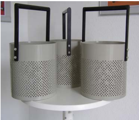
Beizkörbe aus Polypropylen