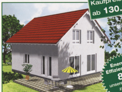
Bungalow Typ 103-160 Wohnfläche im Vollausbau ca.160 m 2

Energie- Effizienzhaus 85 unserer Umwelt zuliebe