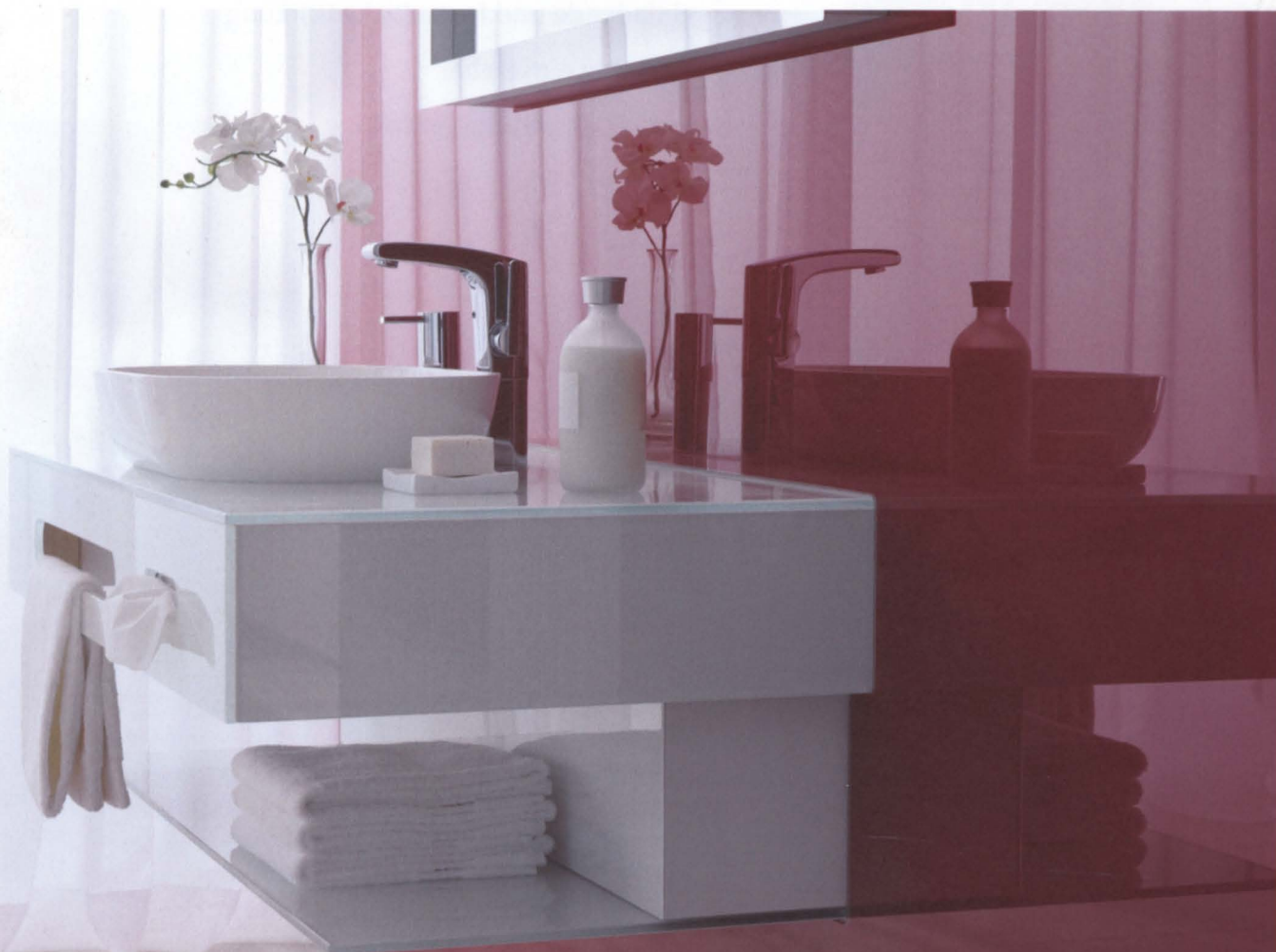
sgg Planilaque als Wandverkleidung im Badezimmer – feuchtraumbeständig und hygienisch

Ob Wohnzimmer, Küche, Bad oder Fassade: Zur Verwirklichung vielfältiger kreativer Gestaltungsideen steht eine Vielzahl an Gläsern zur Verfügung. Wichtig im Umgang mit Glas ist kompetente Beratung und professionelle Herstellung. Das Besondere an unserem Service: Wir planen nicht nur Ihre neuen Einrichtungen. Wir liefern und montieren bei Ihnen vor Ort. Das bedeutet: keine langen Wege und alles aus einer Hand.