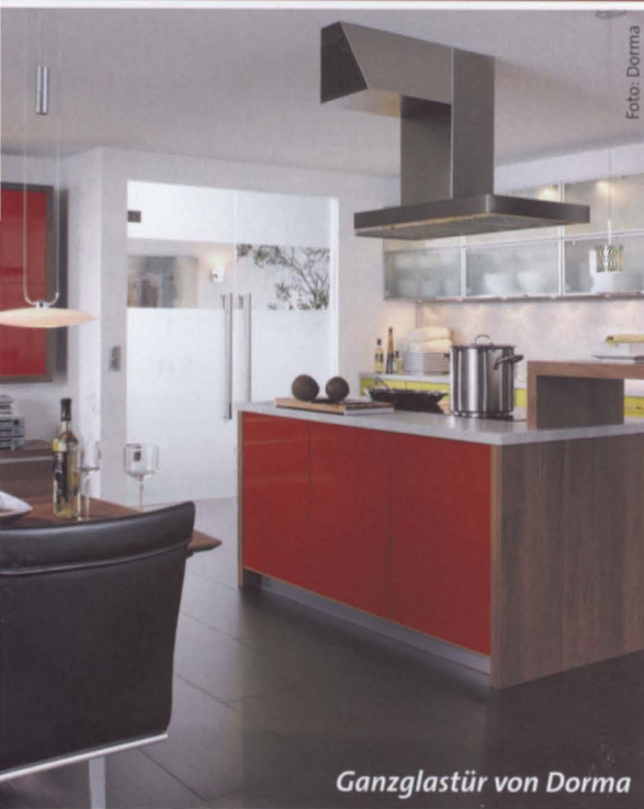
Ganzglastür von Dorma

Offenes Wohnen schafft eine großzügige Atmosphäre. Flexible Glastrennwände sorgen dabei für Struktur und helfen, Energie zu sparen.