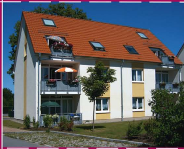
altersgerechtes Wohnen in Negast