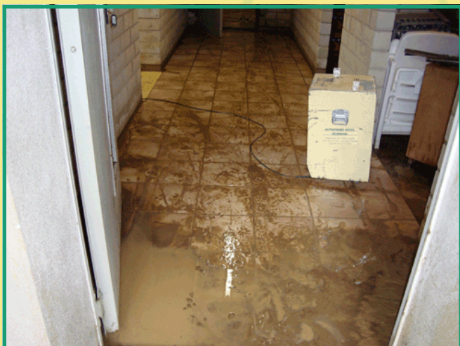
Hochwasserschaden durch Unwetter auf Reiterhof, ca. 50cm Wasser im UG Maßnahmen: Luftentfeuchtung + Ventilatoren