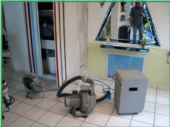
Wasserschaden im 2.OG bis Keller einschließlich Friseursalon im EG mit Isolatinstrocknung und Raumtrocknung