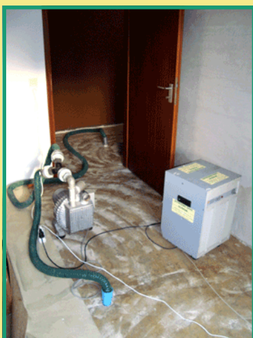
Ursache: defekte Kupferleitungen im Estrich Maßnahmen: Isolationstrocknung in 2 Zimmern mit Flur